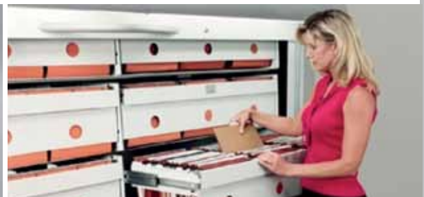
oder in Paternoster-Anlagen