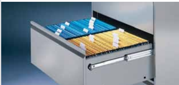
Vertikale Ablage in Schubladen-Schränken